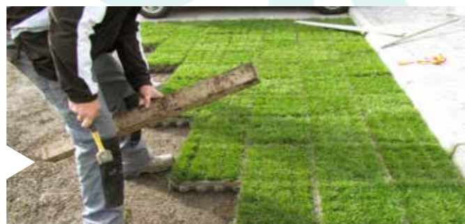
EENVOUDIG EN SNEL TE VERWERKEN