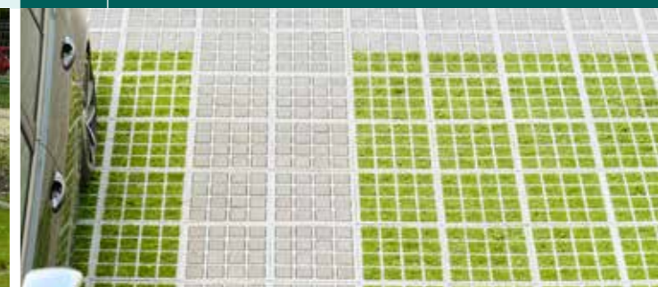
FLEXIBELE EN CREATIEVE COMBINATIES