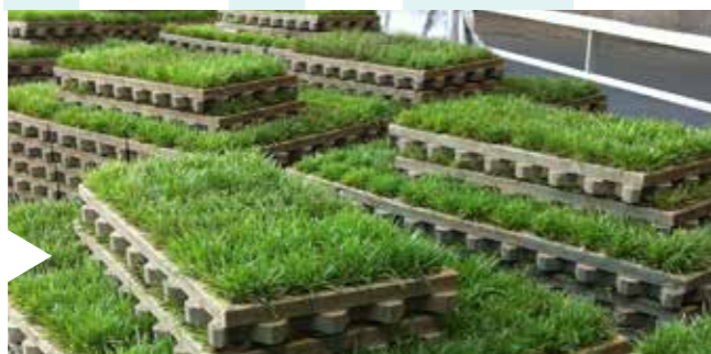
KANT & KLAAR AANGELEVERD

De instant oplossing voor groene parkeerplaatsen